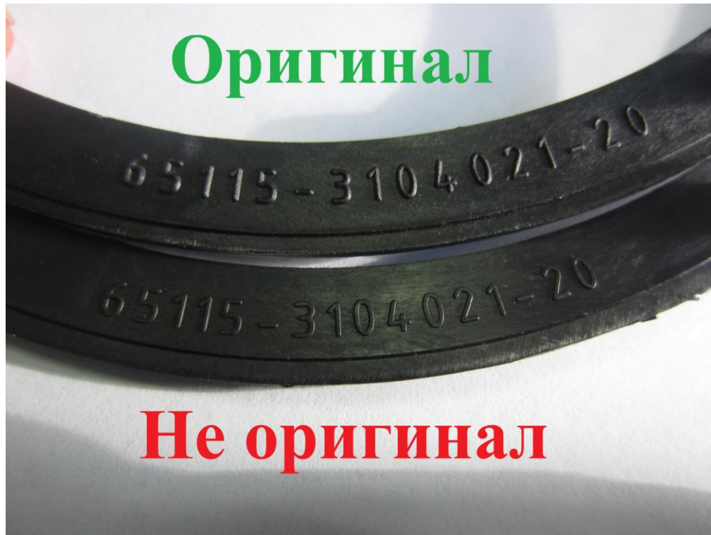
Фото №3. Межбуквенный интервал в номенклатурном номере «65115-3104021-20».