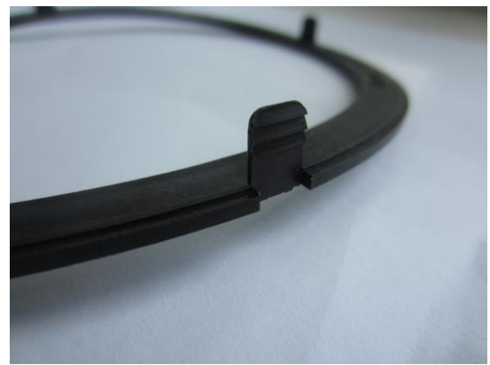
Фото №2.2. Оригинал: четко выраженные зацепы.