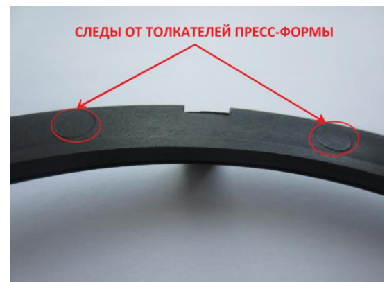
Фото №1.2. Оригинал: наличие следов толкателей пресс-формы.