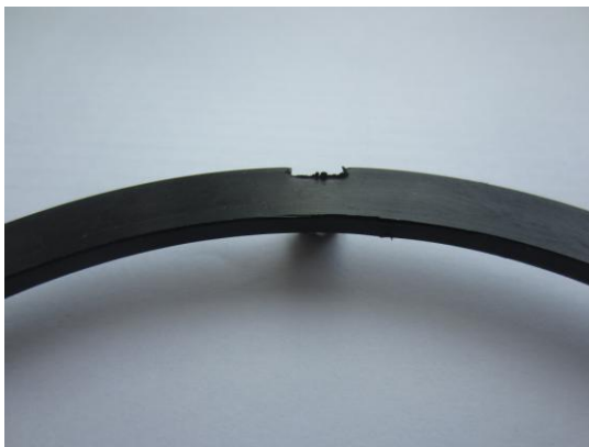
Фото №1.1. Не оригинал: отсутствие следов толкателей пресс-формы.